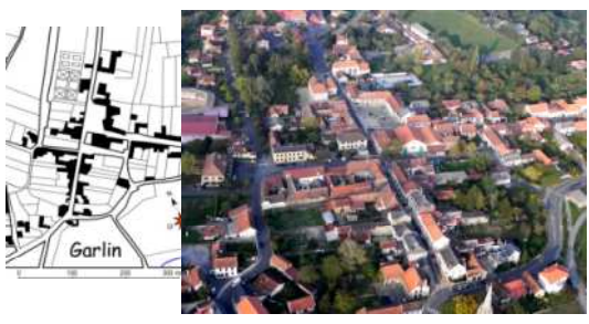
(La structure ronde sur la gauche correspond aux célèbres arènes).

L'ampleur des attributs de centralité (juridiction, bailliage) ont fait jouer à Nay progressivement un rôle de tête de pont du pouvoir vicomtal par rapport aux zones agro-pastorales du piémont, malgré l'exiguïté du territoire accordé.